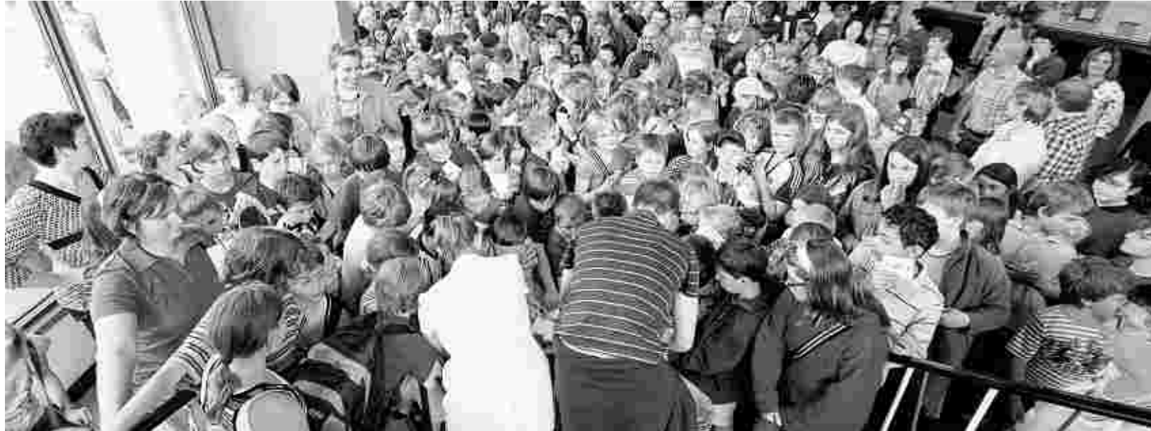
Großer Andrang: Die vielen neuen Kinderuni-Hörer haben gestern den ersten Stempel in ihren Ausweis bekommen.

Die Musiker sitzen natürlich nicht wirklich vor dem Dirigenten. Sie erscheinen auf einer Leinwand und spielen genauso, wie der Dirigent es anzeigt. Der Profes-